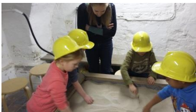
Scherfgoed/kleien (groep 1 en 2)