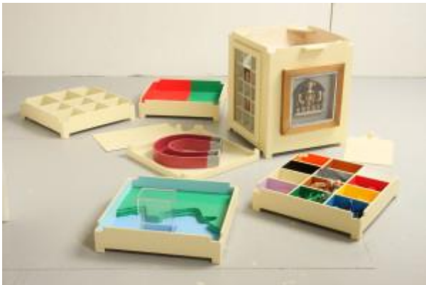
Groep 1 en 2

Daarna gaan ze zelf beeldend aan de slag met de 'stukjes en beetjes' uit de leskist. Zo komt kunst tot leven!